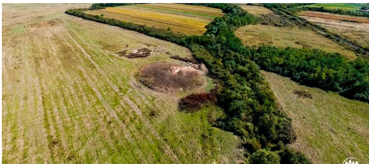
Tumulii „ Gramurada de la Jupani ” din satul Susani, comuna Traian Vuia, județul Timiș.