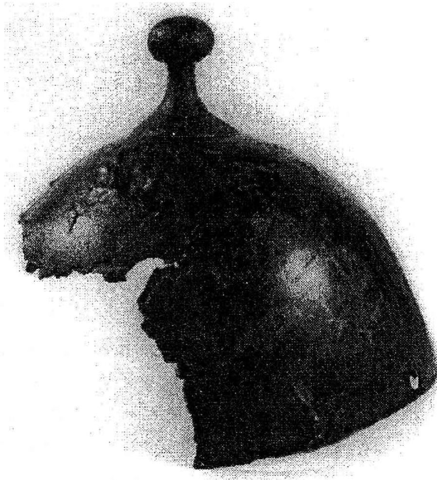
O piesă arheologică unicat: Coiful de bronz „tip clopot” de 2.700 de ani descoperit la Șaroș (jud. Sibiu)