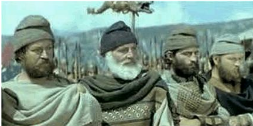
Chipuri de daci în filmul românesc - se vede „căciuladacică” specifică