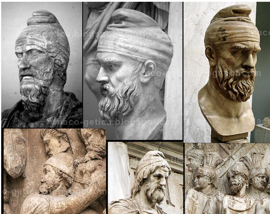
Chipuri de daci – sculpturi romane din antichitate- se vede „căciuladacică” specifică