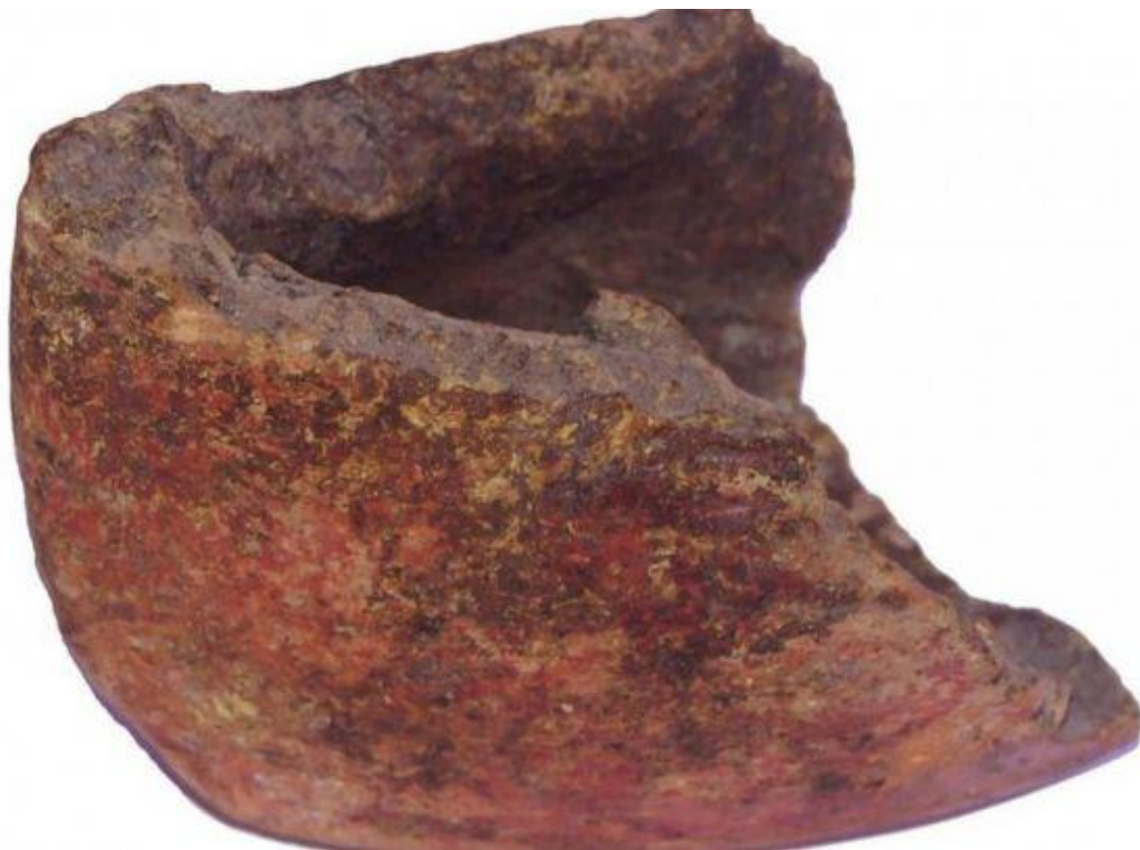
Fragment ambarcațiune miniaturală din lut de 7000 de ani vechime descoperită la Tărtăria. Piese se află în colecția Muzeului Unirii din Alba Iulia