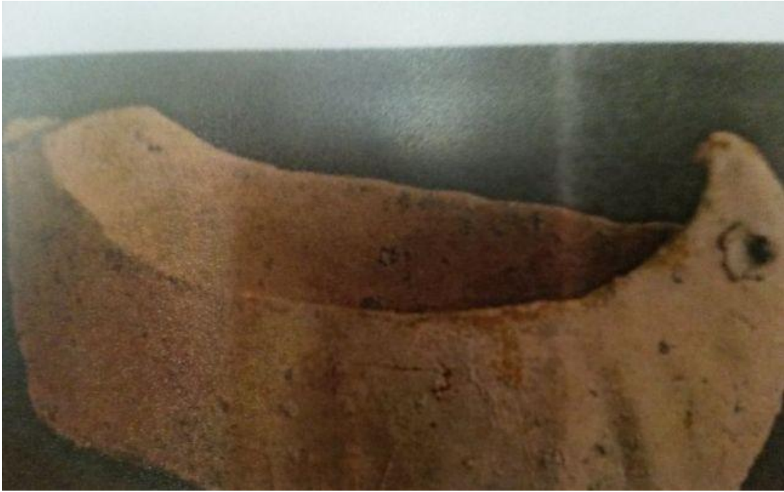
Ambarcațiune miniaturală din lut. Reconstituire.