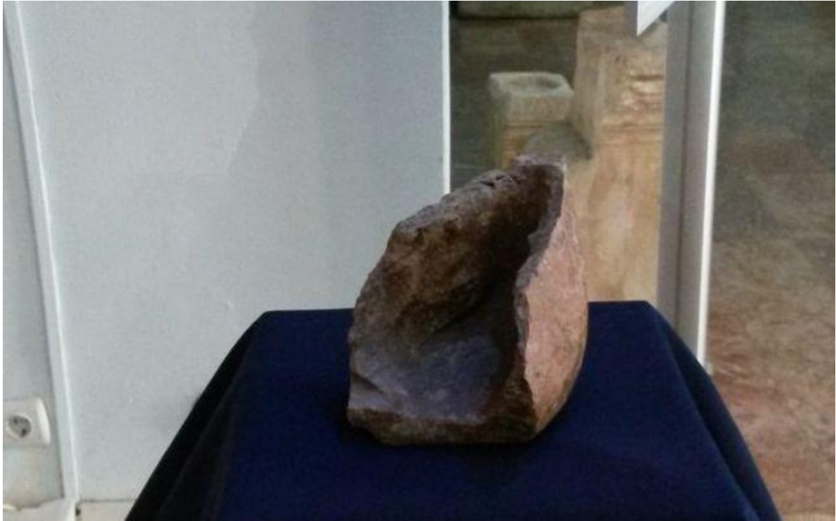
Fragment ambarcațiune miniaturală din lut de 7000 de ani vechime descoperită la Tărtăria. Piese se află în colecția Muzeului Unirii din Alba Iulia