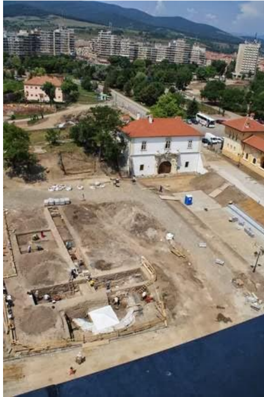
Plan fotografic al zonei descoperirii „Rotondei” ortodoxede secol X descoperită la Alba Iulia