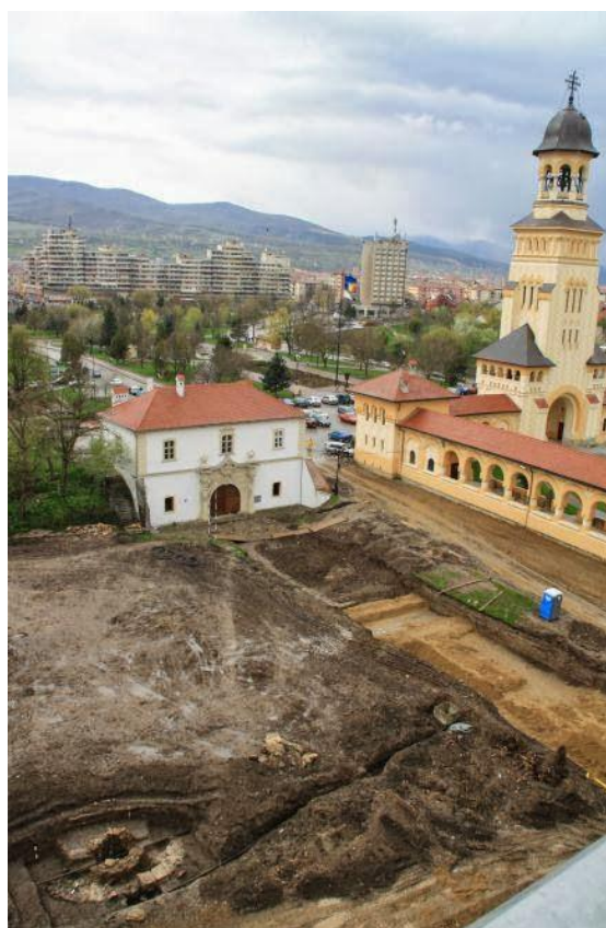
Plan fotografic al zonei descoperirii „Rotondei” ortodoxede secol X, descoperită la Alba Iulia