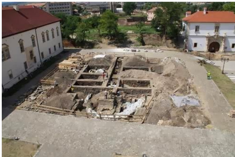
Dimensiunea săpăturilor în ansamblu („Rotonda” ortodoxă) de secol X descoperită la Alba Iulia