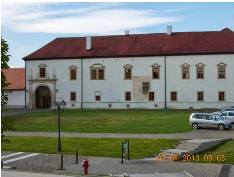
La Alba Iulia, pe locația ruinelor bisericii („Rotonda” ortodoxă din secolul X) se poate remarca frumosul gazon verde apărut în primăvara anului 2013