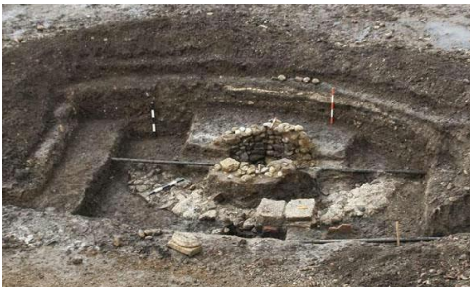
Absida bisericii ortodoxe („Rotonda”) de secol X descoperită la Alba Iulia