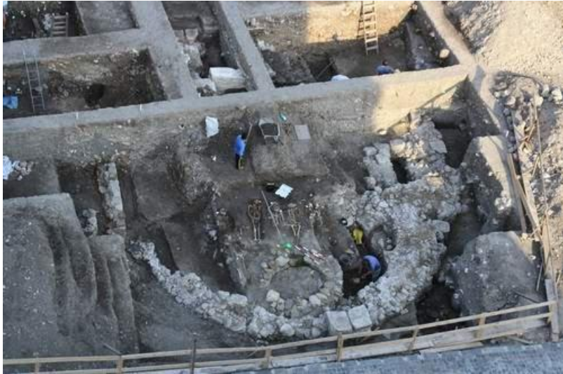
Detaliuabsidă + fundații corpbiserică („Rotonda” ortodoxă) de secol X descoperită la Alba Iulia