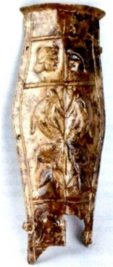
Cnemida romană din bronz placat cu aur de la Giulești-București (sec. II – III)