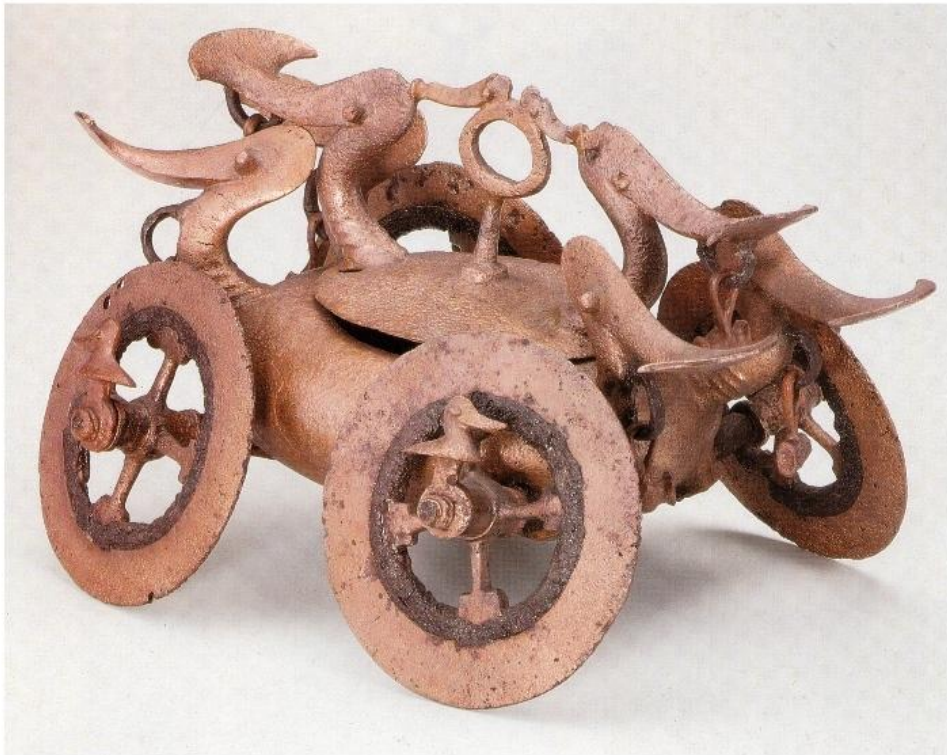
Carul votiv de la Bujoru, în comparație cu artefacte asemănătoare: Carul votiv de la Glasinac (Bosnia Herțegovina) și Carul votiv de la Strettweg Steiermark (Austria).