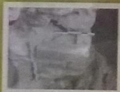
Imagini din timpul lucrărilor. Images taken during the archaeological excavation.

Cavalerul Trac este divinitatea cel mai bine documentată în pantheonul Dobrogei romane. Peste 90 de reprezentări sculpturale, la care se adaugă atestările epigrafice, sunt dovezi de necontestat ale popularității cultului Cavalerului Trac.