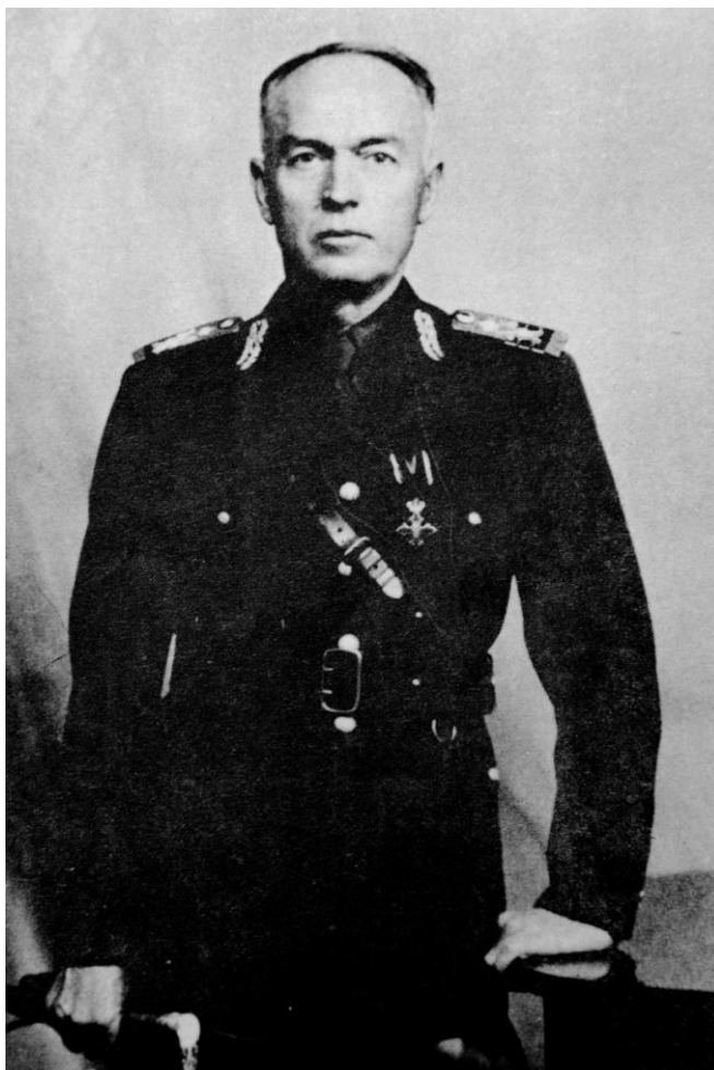
Generalul Ion Antonescu Conducătorul Statului Român Decembrie 1940