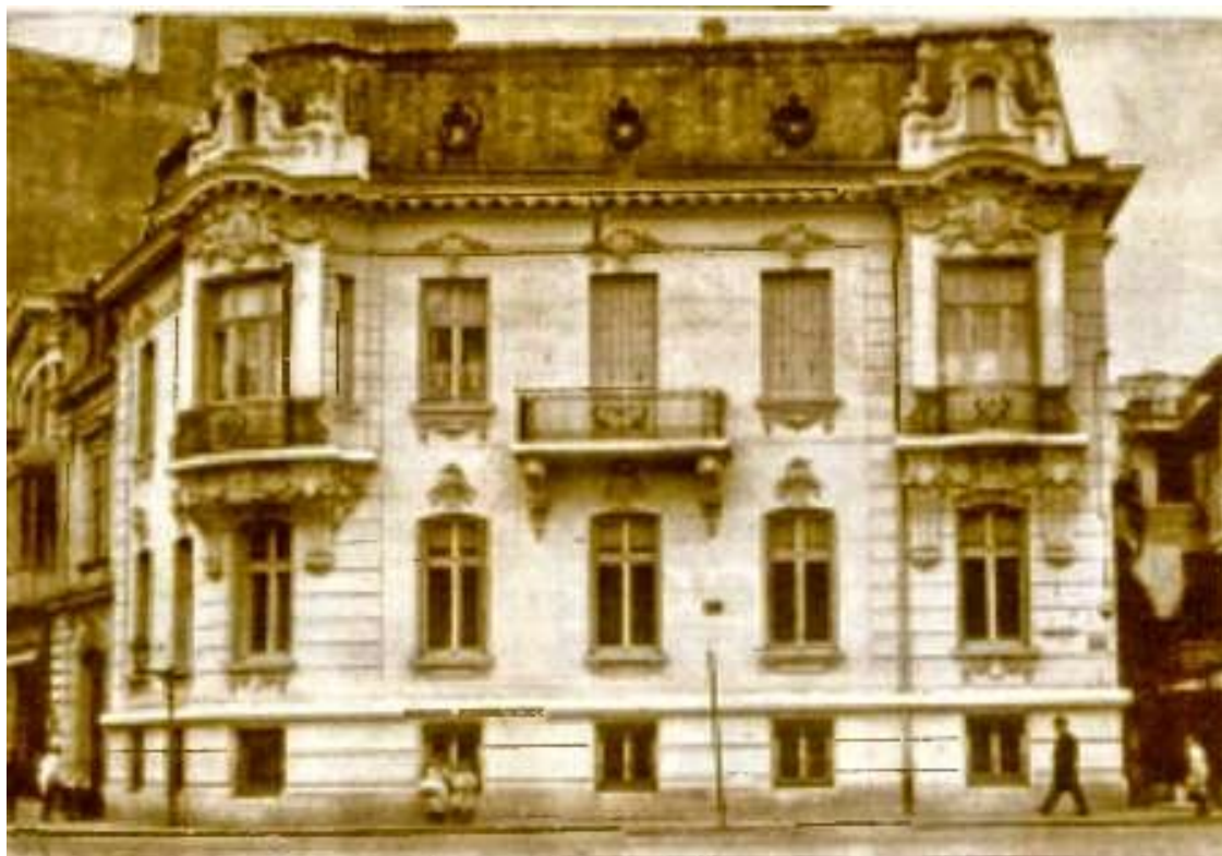
Casa din str. Corabiei nr. 2 (ulterior Clemenceau) în care a locuit fondatorul spitalului Elias