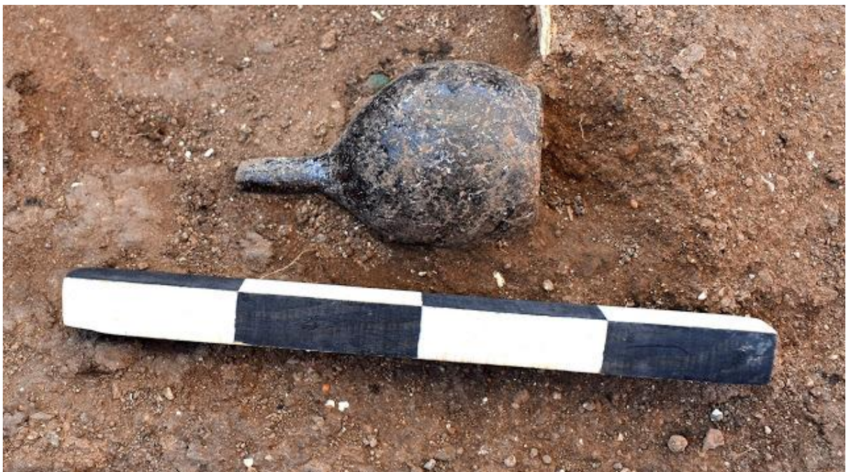
Obiect descoperit în mormântul de la Kaliacra.