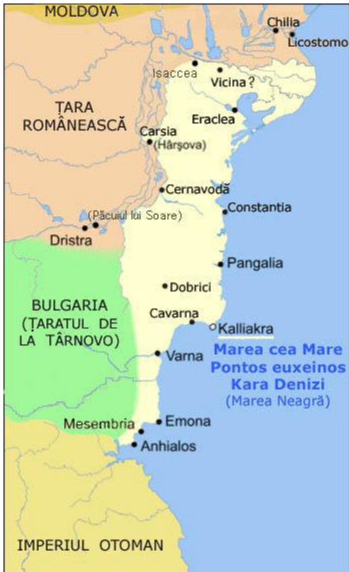
Despotatul Dobrogei sau Țara Cărvunei