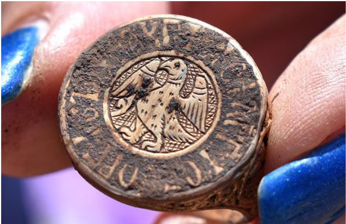
Inelul de tip „Kaloian” descoperit în Cetatea Despotatului Dobrogei – Kaliacra (Bulgaria). Specialiștii spun că pe acesta apare un porumbel. Eu ridic ipoteza că este vorba despre totemul Geților de Aur primordialii, Mama Gaya Vultureanca